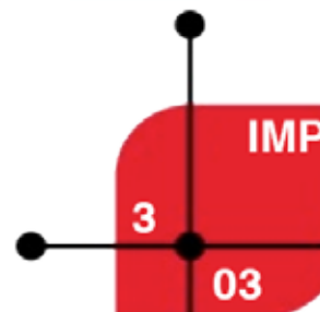
IMAGEN PERSONAL ESTILISMO Y DIRECCIÓN DE PELUQUERÍA

Avda. de Navarra, 141- 50017 ZARAGOZA Tel. 976 324 200 - Fax 976 337 985 www.iessantiagohernandez.com iesshezaragoza@educa.aragon.es